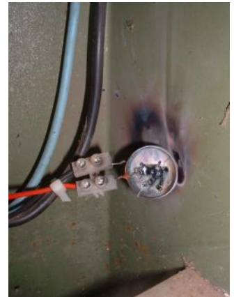
durchgeschossener Varistor nach einem Angriff auf meine Elektroinstallation

Während ich diesen Artikel schrieb, wurden mir ein Bewegungsmelder und ein Halogenscheinwerfer am Haus durchgeschossen. Diese Art von Sabotage-Destruktion findet häufig dann statt, wenn ich etwas schreibe oder tue, was den Special Services an den Nerv geht. Geheimnisse sind es ja nun wahrlich nicht, die ich da ausplaudere, denn es handelt sich um offensichtliche Fakten und Zusammenhänge. Was versprechen sich diese Typen von dieser Art Zerstörungen? Die sind sicher nicht so blöd zu glauben, dass sie mich damit von meinem Vorhaben abbringen können. Es sieht eher nach einer Art von dümmlicher Bestrafung aus. Vermutlich sollen solche Maßnahmen dazu dienen, den nötigen militärischen Druck zur Pflege der öffentlichen Meinung zu erzeugen. Über die handlungsleitende Milch der frommen Denkungsort schreiben die berüchtigten Mindcontrol-Vorkämpfer Paul E. Valley und Michael A. Aquino: "Propaganda, wenn sie als solche erkannt wird - und alles, was eine PSYOP-Einheit produziert, wird als solche erkannt - wird automatisch für eine Lüge oder zumindest für eine Verdrehung der Wahrheit gehalten. Daher wirkt sie nur in dem Ausmaß, wie ein militärisch unter Druck stehender Feind gewillt ist, das zu tun, was wir von ihm wollen. Sie funktioniert nicht, weil wir ihn davon überzeugt haben, die Wahrheit so zu sehen, wie wir sie sehen." 19