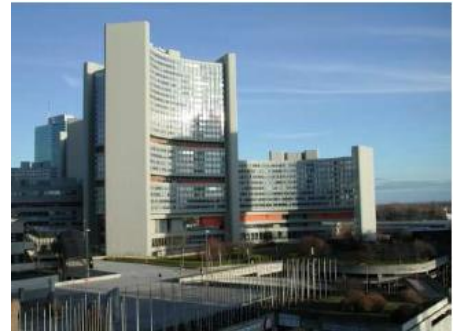
Nato-Hauptquartier in Brüssel