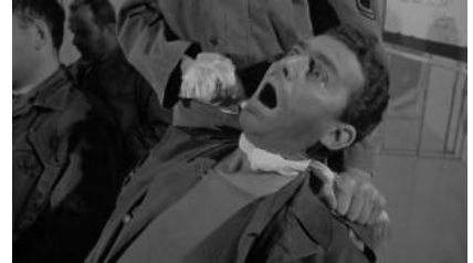
Mord auf Befehl. Szene aus dem Film The Manchurian Candidate