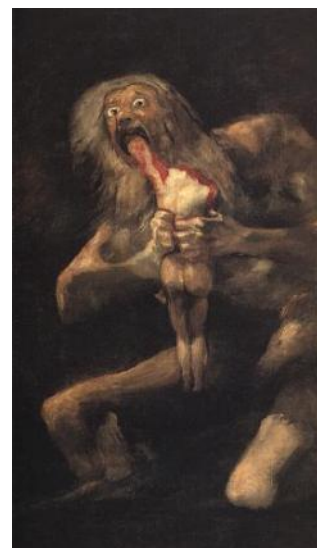
Francisco de Goya: Saturn verschlingt seine Kinder