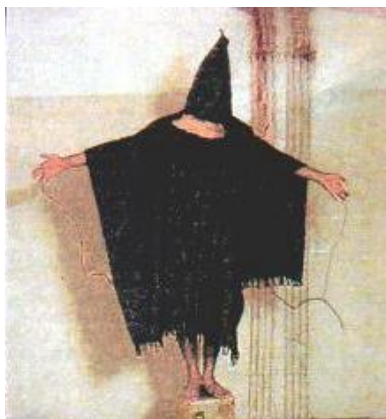
nicht nur in Abu Ghraib

Die Stichhaltigkeit der Behauptung, dass Terrorakte dazu aufgeführt werden, um die staatlichen Sicherheitsmaßnahmen (= Staatsterror) zu verschärfen, wird inzwischen auch durch den Bericht einer 8-köpfigen Autorengruppe von namhaften Juristen im Auftrag der International Commission of Jurists belegt, über den die Neue Züricher Zeitung am 17. Februar 2009 informiert: "Die nach den Terroranschlägen vom