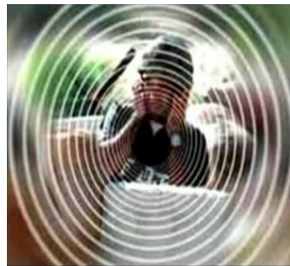
imagen 6: Muchas víctimas escuchan voces, infra- y ultrasonidos