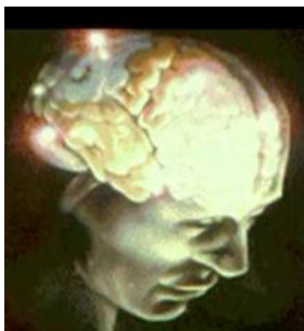
imagen 1: El cerebro es el nuevo objetivo de la conquista militar