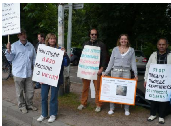
imagen 3: víctimas de acoso electrónico que manifiestan el 7 de julio de 2008 delante del Parlamento Europeo

Estas son las preguntas más frecuentes. No es fácil contestarlas, porque hay que adivinar las respuestas en las huellas del crimen. De principio cada persona puede ser elegida, pero hay acumulaciones de afectados en unos grupos: Muchas víctimas son ancianos, sobre todo mujeres solas de edad y pequeños ingresos; en este caso no hay cualquier razón política. Se trata de acoso por placer de los perpetradores, por abuso para experimentos y entrenamiento, por motivos económicos etc. Otro grupo son personas enfermas o minusválidas, sobre todo