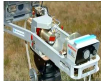
imagen 7: arma electrónica de Raytheon, uno de los líderes del ramo