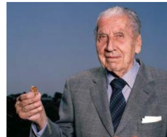
imagen 9: José Delgado muestra dos de sus "stimoceivers" (= implantes de microchips)

Hasta ahora existen pocos documentos y testimonios de países hispanohablantes, pero los existentes indican que el terror electrónico rige en estas naciones en dimensión epidémica también. Es bien conocido que uno de los científicos más reconocidos que trabajaba en el desarrollo de implantes para manipulación neurofisiológica, José Delgado, fue enganchado por el ministro de salud español en 1974, para establecer un nuevo instituto en la universidad de Madrid. 13 El ministro le ofreció mejores condiciones que Delgado las había tenido en la Universidad de Yale en los Estados Unidos.