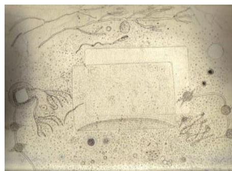
imagen 2: “Esta es la imagen del circuito óptico criminal e ilícito que veo permanentemente en mis ojos a contraluz” comenta un médico mejicano su dibujo del microchip que sospecha tener en su ojo.

Desde el año 2000 una multitud de personas, que está creciendo extremadamente, divulgan ser maltratados y perseguidos por armas electrónicas, sabotaje técnico y terror psicológico. En el Internet se encuentra muchísimos documentos de víctimas presumibles. Los síntomas y fenómenos que denuncian desde todos los continentes coinciden tanto que no puede ser casualidad. Acusan infracciones graves de su integridad corporal y mental, y destrucción de su existencia material y social. Su problema es que hay pruebas de la existencia de armas que pueden causar estas molestias, lesiones y violaciones, pero hasta hoy no es posible comprobar el uso concreto, porque no está disponible ningún método para medir la radiación. Y las instituciones estatales, que podrían examinar las denuncias, niegan cada cooperación para la aclaración. En lugar de ello los denunciadores son enviados con frecuencia a la psiquiatría y inhabilitados. 3