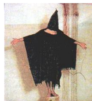
imagen 4: Acoso electrónico es lo mismo – sólo invisible

"... el terrorismo del estado comienza a funcionar en este momento cuando las clases que rigen ya no pueden efectuar sus negocios. En nuestros países no habría tortura, si no fuera eficaz, y la democracia tendría continuación, si pueda garantizar que los poderosos no pierdan el control .... La población se convirtió de un momento a otro en el enemigo "interior". Cada indicio de vida, sea protesta o también sólo duda, significa por la vista de la doctrina militar y de la seguridad nacional un desafío peligroso. Así creaban mecanismos complicados para prevención y castigo. Atrás de la apariencia está escondida una razón profunda. Para que funcione eficazmente, la represión tiene que aparecer arbitraria. Aparte del respirar cada actividad humana puede ser un delito ... De esta manera el pánico por la tortura difunda en la población entera paralizando como un gas que invade las casas y se introduce furtivamente en el seso de todos los ciudadanos ... No hay cadáveres ni responsables. Así son los líderes de las matanzas – siempre officiosos, jamás oficial – seguros de cada castigo, y así difunda el miedo colectivo tanto más rápido. Cada crimen llega a una incertidumbre angustiada de los parientes de la víctima y es al mismo tiempo una advertencia para los otros. El terrorismo del estado se propuso paralizar a la población completa por miedo." 4