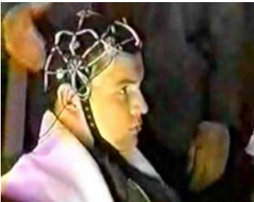
imagen 8: En investigaciones extensas durante unas décadas descifraban los códigos y frecuencias por los que el cerebro comunica y desarrollaban tecnologías para manipularlo.

Los testimonios de personas, que sostienen ser vigilados, manipulados y torturados por una red mafiosa de agentes laicos, nominan a sus vecinos, colegas, parientes, a policías, funcionarios, médicos y otros perseguidores sobornados para ser los activistas. La descripción coincide con el sistema de la NSA descrito en una acusación de John St. Clair Akwei, que es un agente anterior de este servicio secreto. Según este documento, ya en los años ochenta, estaba en función un sistema computerizado de altísima tecnología para vigilancia y control de cualquier persona en los Estados Unidos, desde un departamento de 100 especialistas que trabajaban en turnos por 24 horas los 7 días de la semana. 9 Según otro documento de estrategias militares del Ministerio de Defensa estadounidense, escrito en el año 1994, nos enteramos que intentaban ampliar la implementación y el uso de estas tecnologías y métodos para una "Revolución Militar" en el mundo entero. Planeaban conseguir la aprobación del Presidente en el año 2000 para el uso de estas armas psicofísicas. Los autores explican las medidas necesarias de decepción y propaganda para la infiltración de la sociedad y del estado con fines de introducir este sistema que contraviene y quita los derechos humanos y constitucionales de propósito. 10