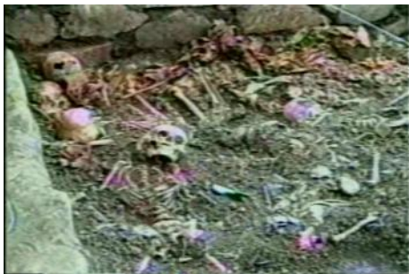
imagen 10: fosa común de un asalto por escuadrón de la muerte

En su "blog" "Análisis de la Naturaleza criminal del Opus Dei" 14 el autor presenta una documentación abundante de la relación